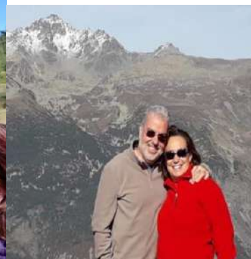
Coppia referente per la Cultura