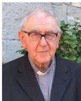
Consigliere Spirituale di Settore