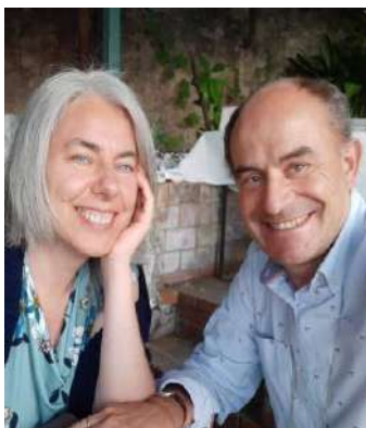
Coppia di collegamento delle equipies: 50, 78, 89, 65, 21