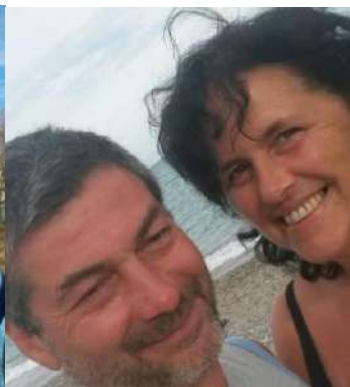
Coppia di collegamento delle equipages: 12, 25, 79, 85, 95