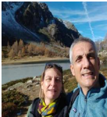
Coppia responsabile Settore D