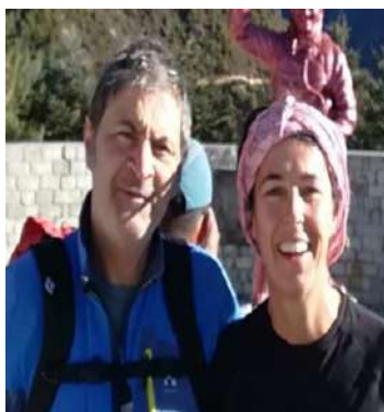
Coppia Diffusione, Informazione e Pilotaggio