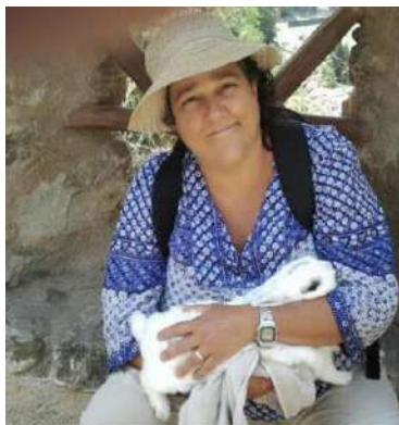
Collegamento eq: 10, 58, 93, 96, 102