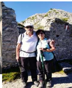
Coppia referente per la Cultura