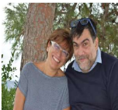
Coppia responsabile Settore B