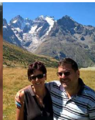
Coppia di collegamento delle equipages: 54, 81, 101, 106, 113