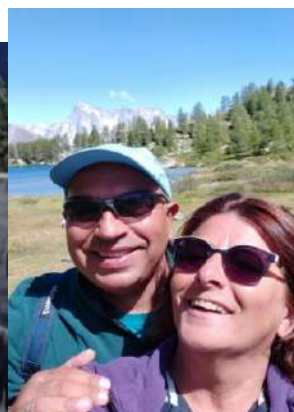
Coppia di collegamento delle equipes: 2, 60, 70, 86, 112