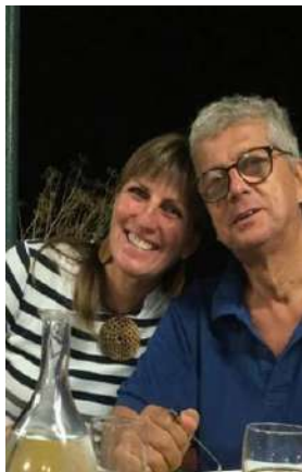
Coppia Diffusione, Informazione e Pilotaggio