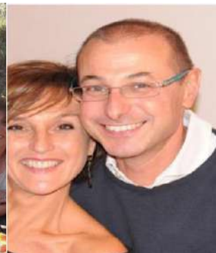
Coppia di collegamento delle equipes: 38, 44, 67, 100