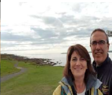
Coppia referente per la Cultura