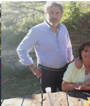
Coppia di collegamento delle equipes: 26, 92, 103, 115, 75