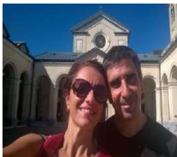
Coppia di collegamento delle equipages: 66, 68, 74, 88, 98, 99