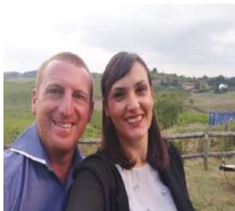
Coppia Diffusione, Informazione e Pilotaggio