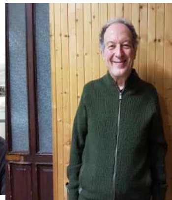
Consigliere Spirituale di Settore